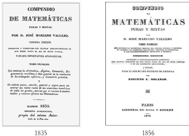
Figura 2 En un mismo texto diferentes contenidos

La versión del Compendio de Matemáticas , escrito por el autor español J.M. Vallejo alrededor de 1817 e impreso en Francia cerca de 1848 para enviarse como manual de enseñanza de la matemática a los colegios mexicanos, fue ampliamente recortada: por ejemplo, en la versión americana no aparece la introducción, se cortaron o evitaron libros completos y conocimiento matemático importante que hubiera colocado a México en el contexto educativo y científico europeo del siglo XIX (la figura 2 muestra las carátulas de la versión española de 1835 y de la edición mexicana de 1856). En la parte correspondiente a la aritmética de la versión para América no aparecen las definiciones de fracciones decimales periódicas infinitas colocadas en las páginas 66 y 67 del texto español. La rúbrica del cálculo con decimales era fundamental para adoptar el siguiente paso, que consistía en aprender el sistema métrico decimal. Para nuestro país, el sistema mé-