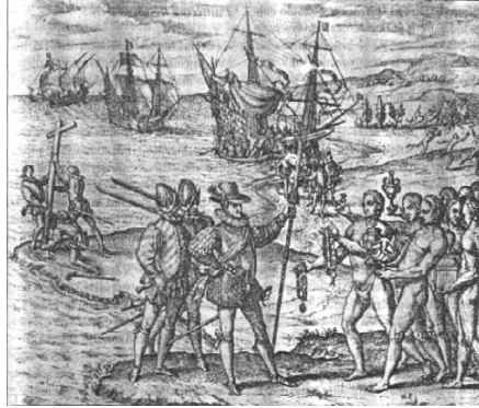
Figura 1 Arribo de Colón a las Antillas

Rúbricas que acompañan a las ilustraciones